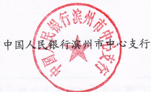
中国人民银行滨州市中心支行