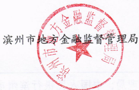
滨州市地方金融监督管理局